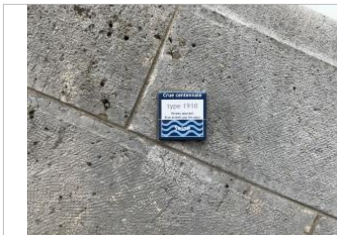
Projet de repère 1910 - Auteur: Artelia