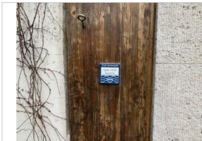
Projet de repère 1910 - Auteur: Artelia