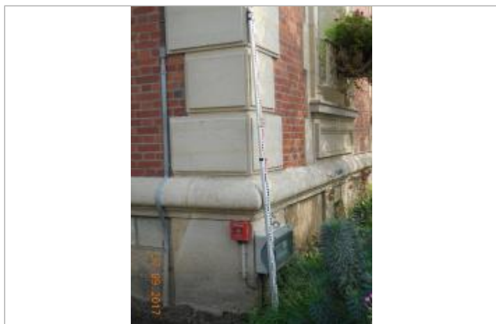
Projet de repère 1910 - Auteur : Artelia