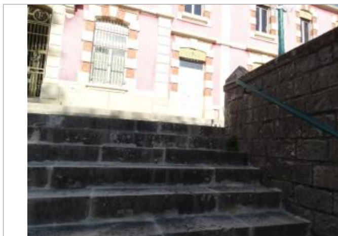
3eme marche en partant du haut