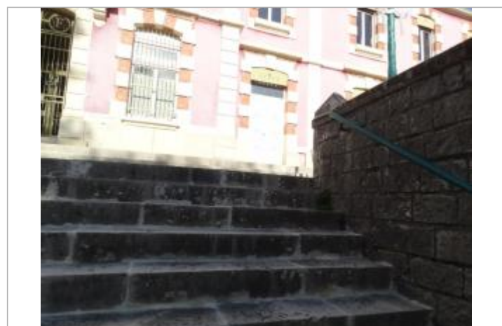
3eme marche en partant du haut