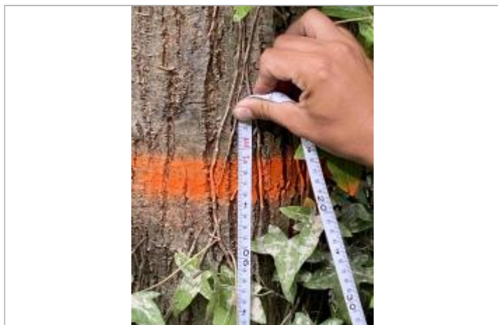
Marque de peinture sur tronc de l'arbre à 95 cm/sol.

NIVELLEMENT SPC SACN. LE SPC N'EST PAS GÉOMÈTRE EXPERT, LES COTES SONT DONNÉES À TITRES INDICATIF. - 27/10/2021