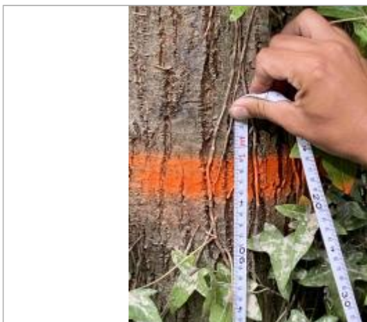
Marque de peinture sur tronc de l'arbre à 95 cm/sol.

NIVELLEMENT SPC SACN. LE SPC N'EST PAS GÉOMÈTRE EXPERT, LES COTES SONT DONNÉES À TITRES INDICATIF. - 27/10/2021