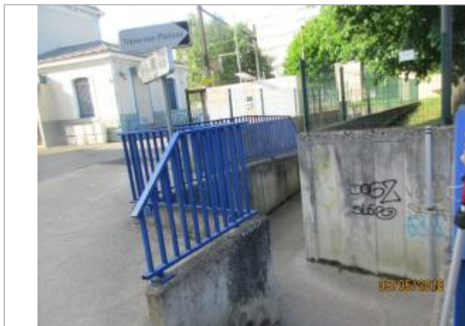
Projet de site - Auteur: Artelia