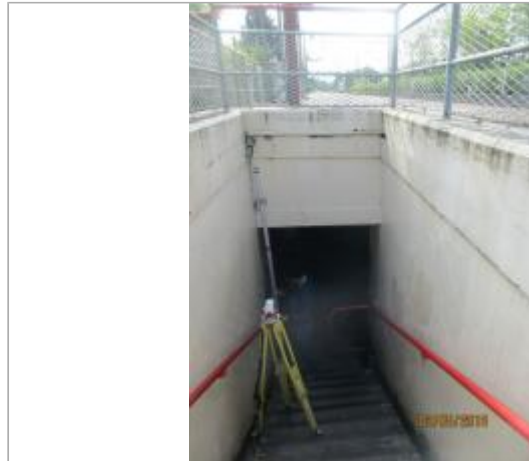
Projet de site - Auteur: Artelia