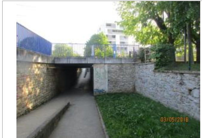
Projet de site - Auteur: Artelia