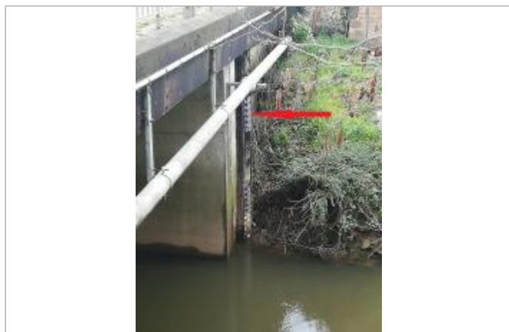
Echelle limnimétrique de la grenouillère pont RD 777

SOURCE DE REPÉRAGE : SPC VILAINE COTIERS BRETONS - 08/12/2016