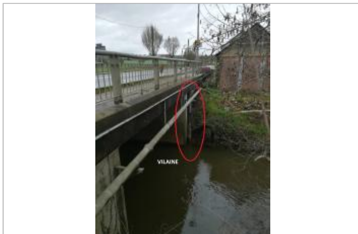
Echelle limnimétrique de la grenouillère pont RD 777 en 2019