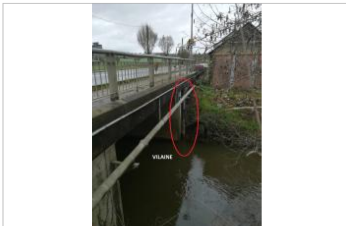
Echelle limnimétrique de la grenouillère pont RD 777 en 2019