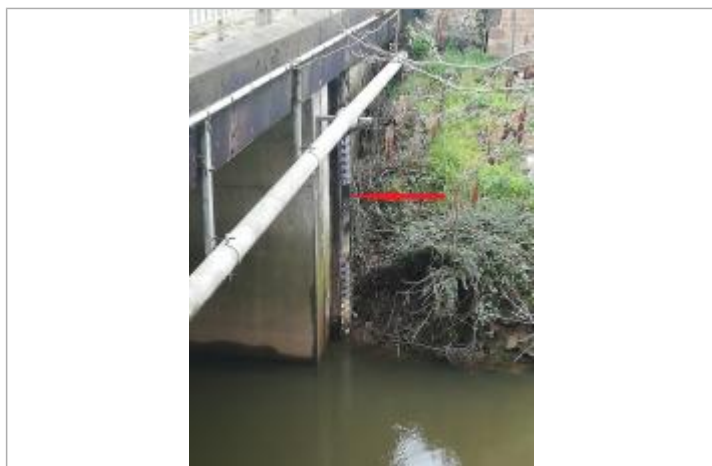
Echelle limnimétrique de la grenouillère pont RD 777

SOURCE DE REPÉRAGE : SPC VILAINE COTIERS BRETONS - 08/12/2016