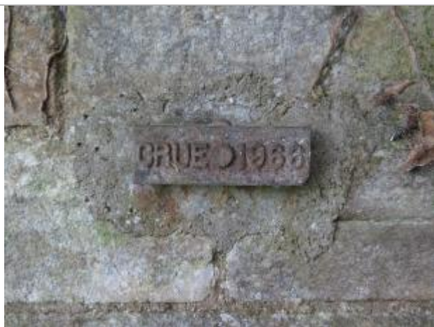
Repère normalisé de crues IGN

Système altimétrique : NGF IGN 1969 (système normal)