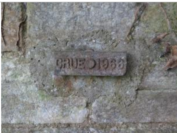
Repère normalisé de crues IGN

Système altimétrique : NGF IGN 1969 (système normal)