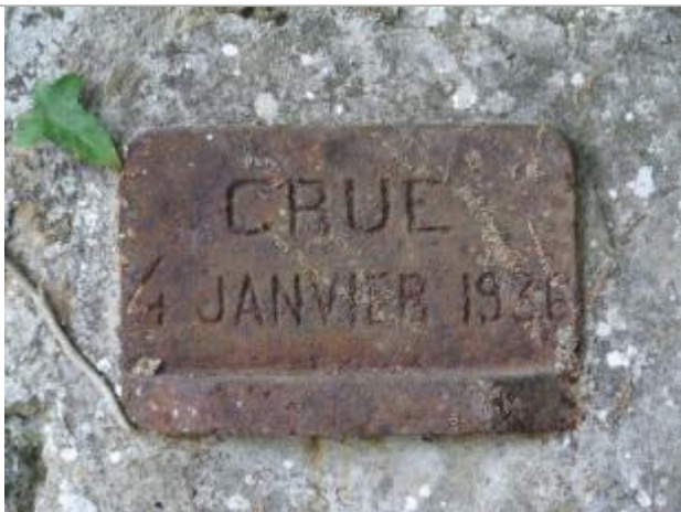
Repère normalisé de crues IGN

Altitude calculée de l'eau (en m) : 58.097 m