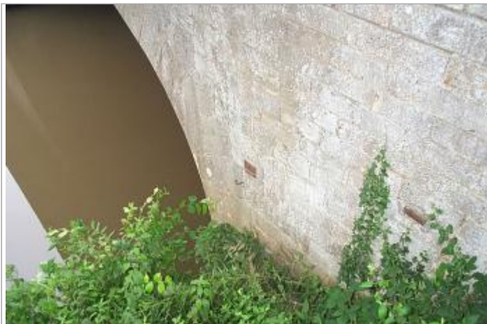
Vue du site en 2003

Coordonnées WGS84 : X: -1.22942800 / Y: 48.09131300