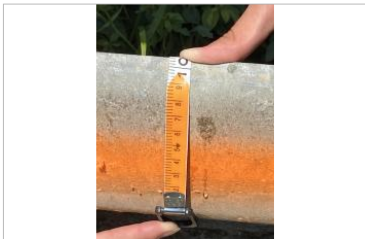
Marque de peinture sur rambarde du parc à vaches à 10,5 cm du de la glissière basse.

NIVELLEMENT SPC SACN. LE SPC N'EST PAS GÉOMÈTRE EXPERT, LES COTES SONT DONNÉES À TITRES INDICATIF. - 27/10/2021