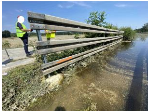
Triple rambarde de parc à vaches à l'intersection de chemin bitumé et RD 37.