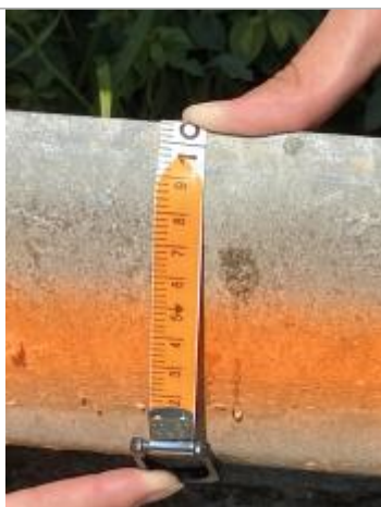
Marque de peinture sur rambarde du parc à vaches à 10,5 cm du de la glissière basse.

Altitude calculée de l'eau (en m) : 62.383 m