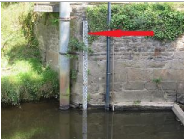
Echelle limnimétrique de la station de Saint-Jouan-de-l'Isle

Altitude calculée de l'eau (en m) : 63.51 m