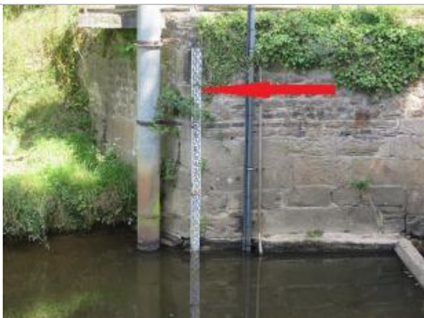
Echelle limnimétrique de la station de Saint-Jouan-de-l'Isle

Altitude calculée de l'eau (en m) : 63.35 m