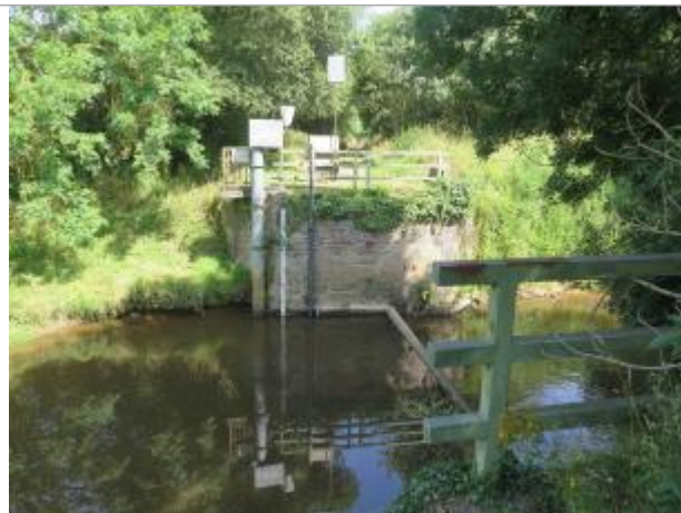
Vue d'ensemble du site ( 17/07/2019)