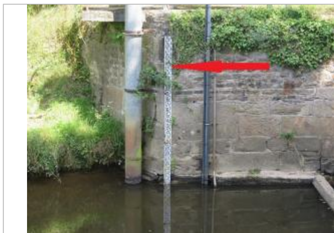
Echelle limnimétrique de la station de Saint-Jouan-de-l'Isle

Altitude calculée de l'eau (en m) : 63.35 m