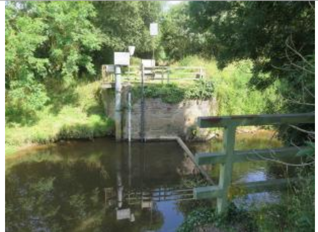
Vue d'ensemble du site ( 17/07/2019)