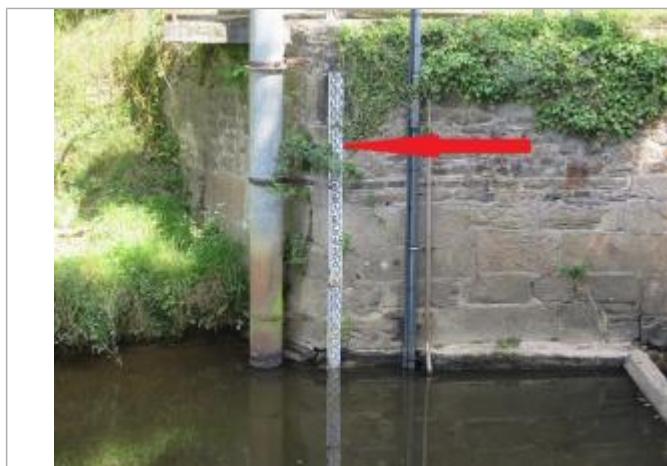
Echelle limnimétrique de la station de Saint-Jouan-de-l'Isle

Altitude calculée de l'eau (en m) : 63.23 m