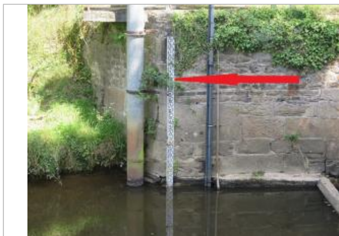
Echelle limnimétrique de la station de Saint-Jouan-de-l'Isle

Altitude calculée de l'eau (en m) : 63.14 m