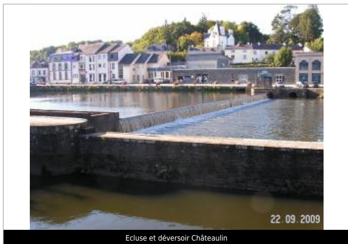
Ecluse et déversoir Châteaulin

Altitude calculée de l'eau (en m) : 6.72 m