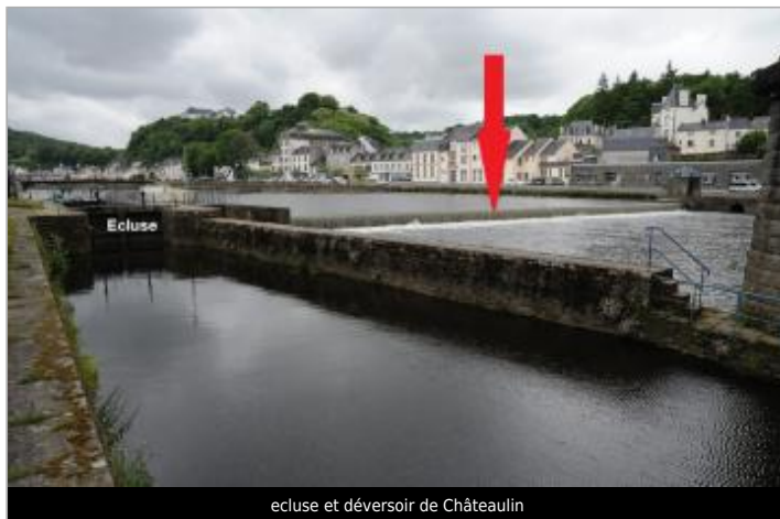
ecluse et déversoir de Châteaulin

Coordonnées WGS84 : X: -4.09009380 / Y: 48.19755900