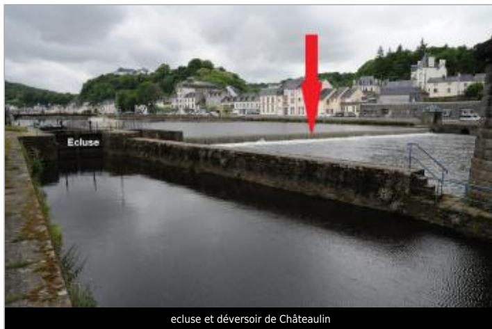
ecluse et déversoir de Châteaulin