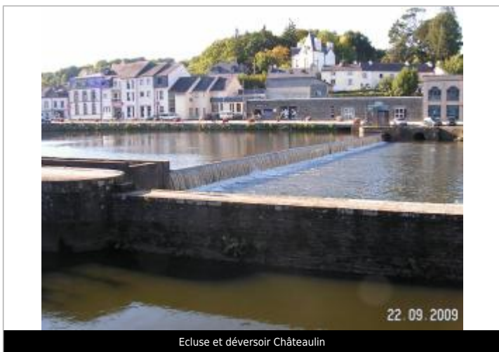
Ecluse et déversoir Châteaulin

Code : SPC 29026_02_1974 Date de mise à jour : 18/10/2021 Auteur : SPC VCB