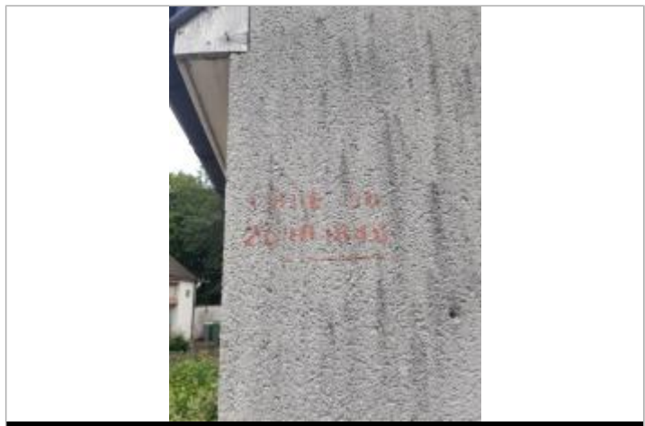
Vue rapprochée du repère, en 2021

MARQUE Texte : CRUE DU 28.10.1846 Maximum de l'inondation : Oui Visibilité : Oui État du repère : Mauvais Pérennité : Moyenne