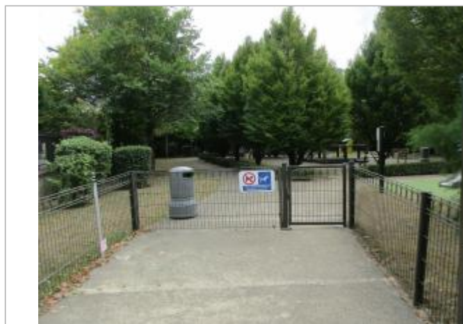
Projet de repère de crue reconstitué 1910 - Auteur : Artelia