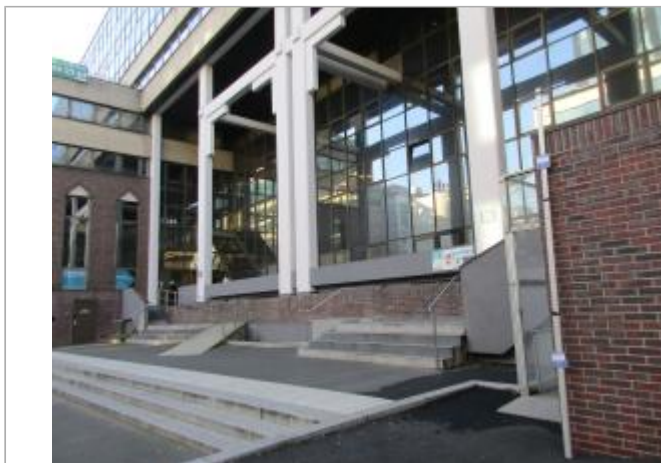
Projet de site - Auteur: Artelia

Coordonnées WGS84 : X: 2.39565700 / Y: 48.81990800