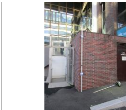
Projet de repère de crue reconstitué 1924 - Auteur : Artelia