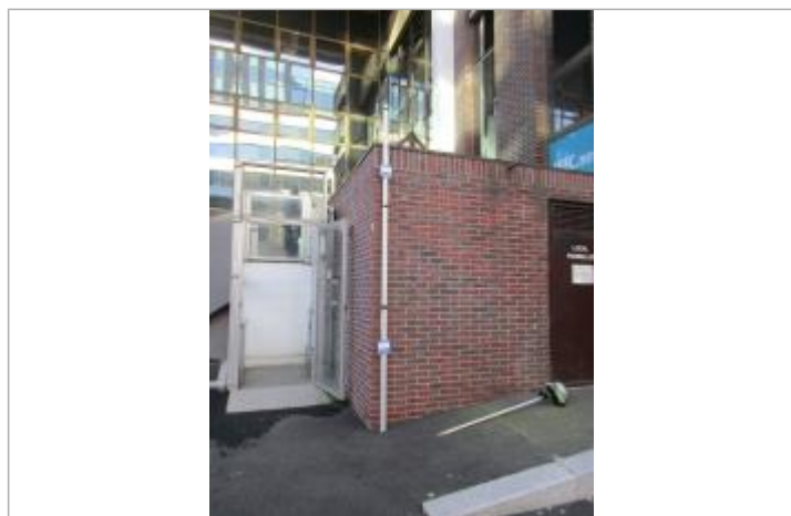
Projet de repère de crue reconstruit 1924 - Auteur : Artelia