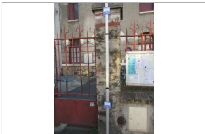
Projet de repère de crue reconstruit 1924 - Auteur : Artelia