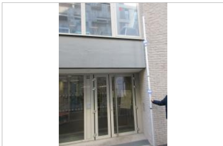
Projet de repère de crue reconstitué 1924 - Auteur : Artelia