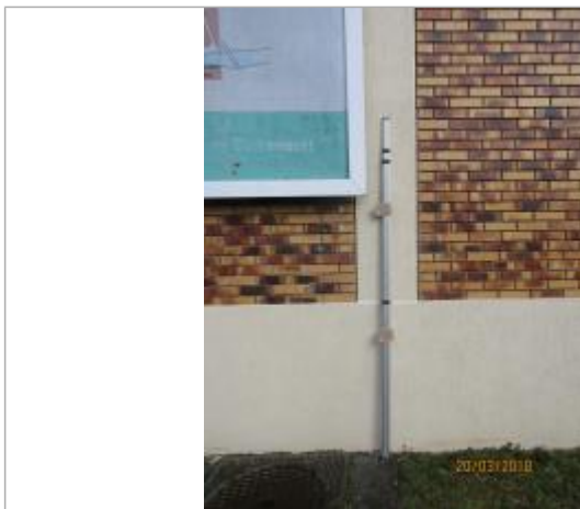
Projet de repère 1924 - Auteur: Artelia

Altitude calculée de l'eau (en m) : 36.75 m