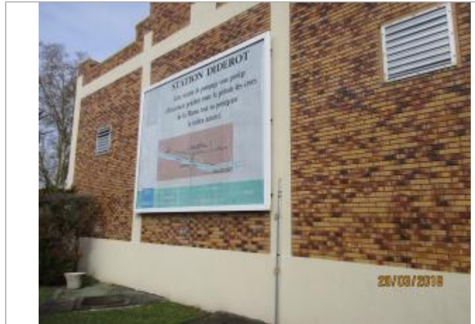
Projet de site - Auteur: Artelia

Coordonnées WGS84 : X: 2.49238500 / Y: 48.81288780