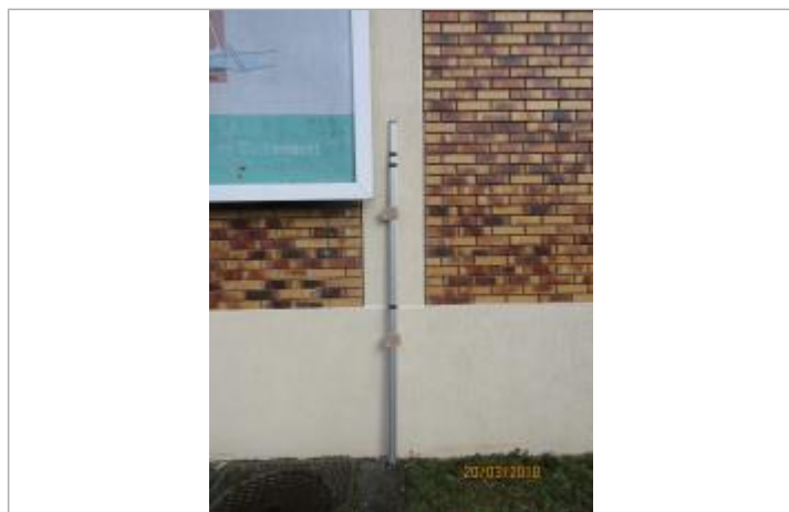
Projet de repère 1924 - Auteur: Artelia