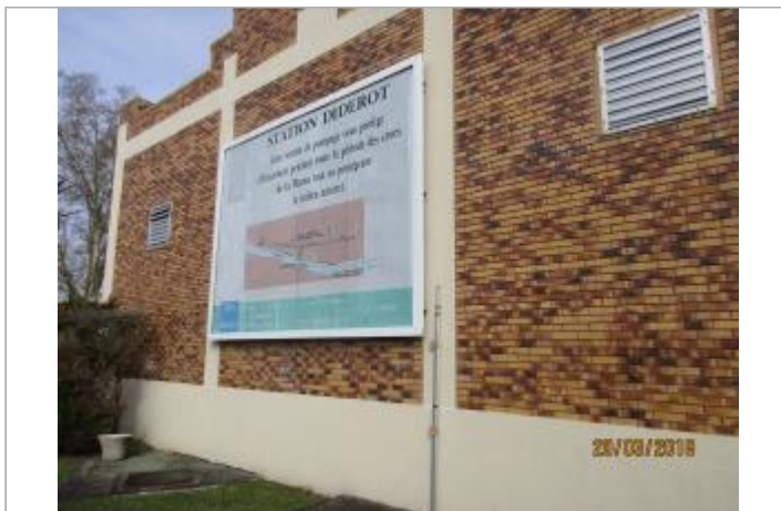
Projet de site - Auteur: Artelia