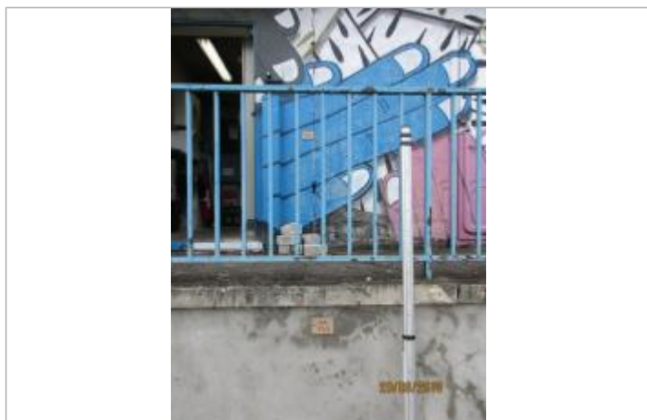
Projet de repère 1924 - Auteur : Artelia