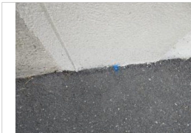
Projet de repère de crue reconstruit 1910 - Auteur : Artelia