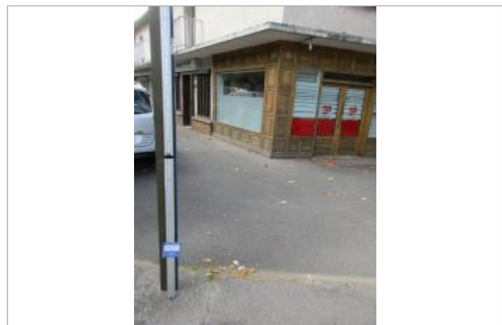
Projet de repère de crue reconstruit 1910 - Auteur : Artelia

GÉNÉRAL Code : ARTELIA21_R_0156_1 Date de mise à jour : 15/10/2021 Auteur : SPC SMYL