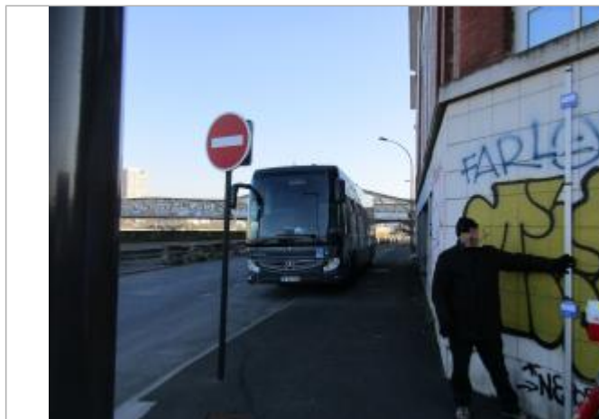
Projet de repère de crue reconstitué 1910 - Auteur: Artelia