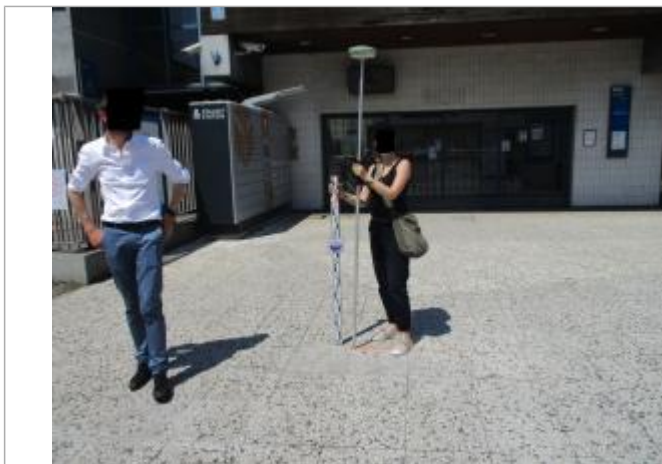
Projet de repère 1910 - Auteur: Artelia