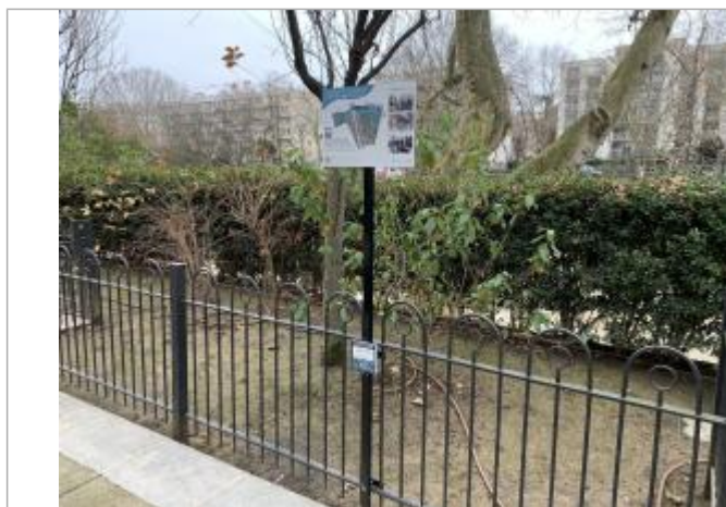
Projet de repère 1910 - Auteur : Artelia