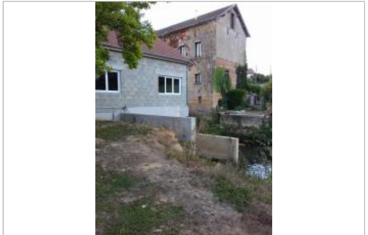
Aval rive droite de l'usine hydroélectrique