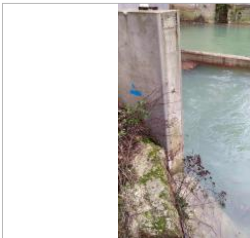
Marque sur le rebord mur en béton

Altitude calculée de l'eau (en m) : 134 m