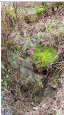
Marque sur une pierre

Altitude calculée de l'eau (en m) : 134.89 m