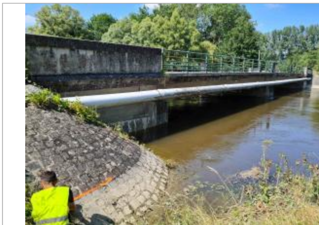
Talus sous le Pont de la RD 37

Coordonnées WGS84 : X: 4.11134560 / Y: 49.47047000