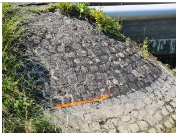
Marque peinte, à 14 pavés en partant du haut, au milieu du joint entre 14 et 15 ème pavé.

NIVELLEMENT SPC SACN. LE SPC N'EST PAS GÉOMÈTRE EXPERT, LES COTES SONT DONNÉES À TITRES INDICATIF. - 27/10/2021