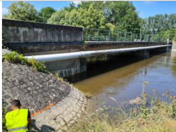
Talus sous le Pont de la RD 37