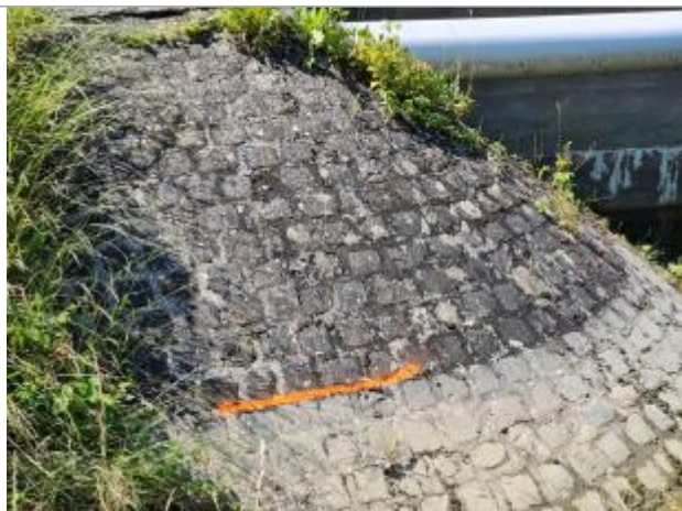
Marque peinte, à 14 pavés en partant du haut, au milieu du joint entre 14 et 15 ème pavé.

NIVELLEMENT SPC SACN. LE SPC N'EST PAS GÉOMÈTRE EXPERT, LES COTES SONT DONNÉES À TITRES INDICATIF. - 27/10/2021