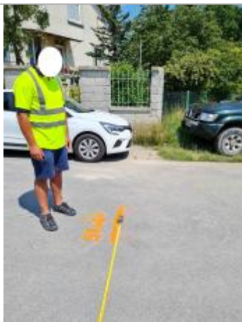
Marque de peinture à 2.70 m du trottoir dans axe poteau béton maison (photo)

Altitude calculée de l'eau (en m) : 57.86