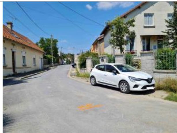
Chaussée de la rue des Prés en face du n°13.