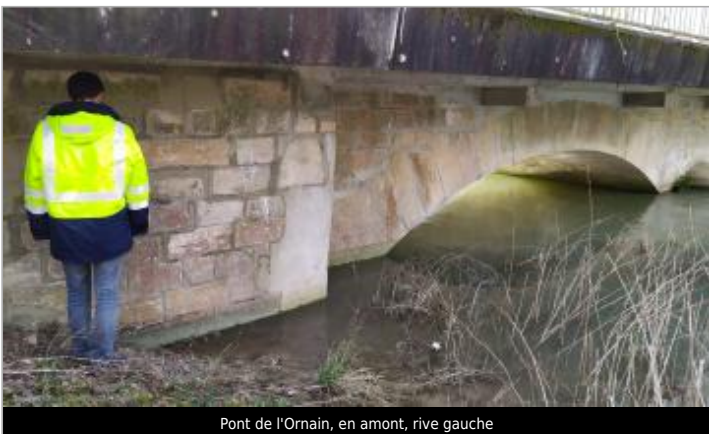
Pont de l'Ornain, en amont, rive gauche

GÉOLOCALISATION Coordonnées WGS84 : X: 4.88761788 / Y: 48.79959020 Coordonnées RGF93 (Lambert 93) : X: 838639.92 / Y: 6857158.44 Coordonnées RGF93 (ETRS89) : X: 4.8876179 / Y: 48.7995902 Code Hydro: F56-0400 Rive de référence: Gauche