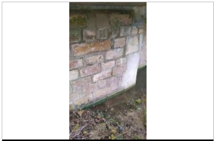
Marque à l'amont du pont, RG

GÉNÉRAL Code : 51006-03 Date de mise à jour : 13/10/2021 Auteur : SPC SAMA