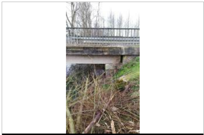
Marque en amont du pont

GÉNÉRAL Code : 51433-02 Date de mise à jour : 13/10/2021 Auteur : SPC SAMA