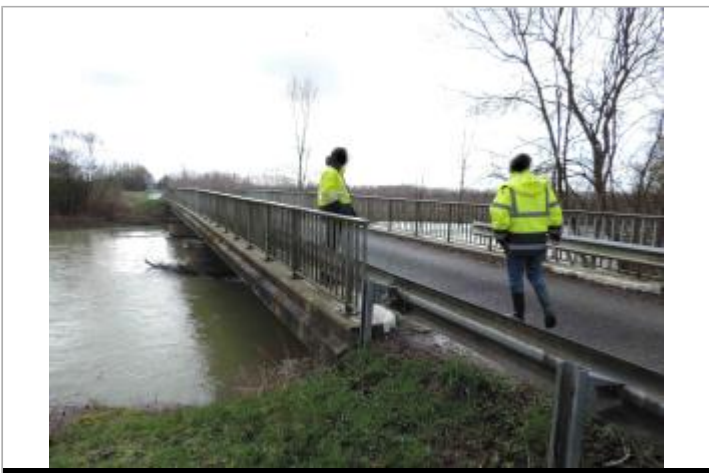
Pont sur la D58

GÉOLOCALISATION Coordonnées WGS84 : X: 4.67157820 / Y: 48.75114000 Coordonnées RGF93 (Lambert 93) X: 822889 / Y: 6851415 Coordonnées RGF93 (ETRS89) : X: 4.6715782 / Y: 48.75114 Code Hydro: F5--0200 Rive de référence: Droite