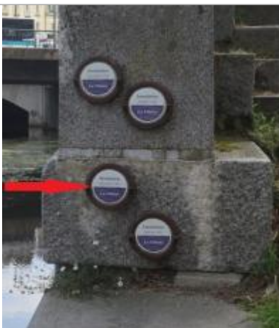
Repère normalisé de l'inondation du 29 décembre 1999

Altitude calculée de l'eau (en m) : 24.901 m