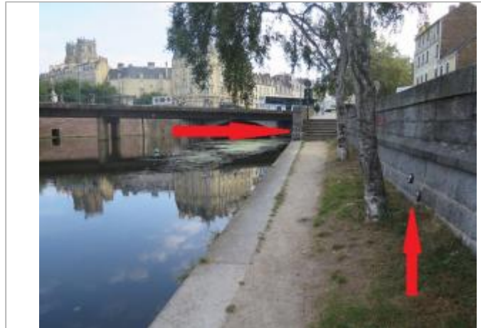
promenade le long de la Vilaine face au 5 quai de la prévalaye