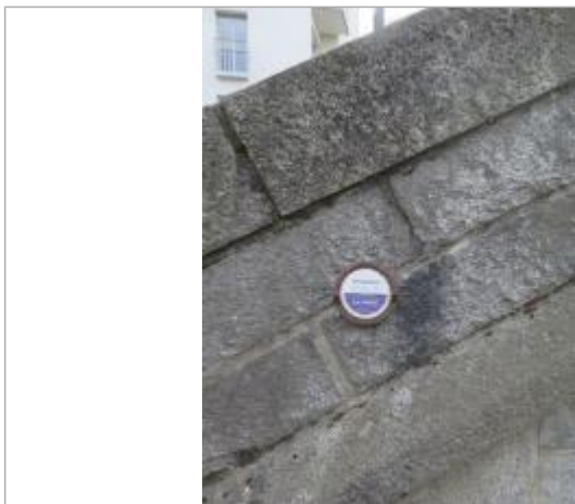
Repère normalisé de l'inondation du 17 novembre 1974