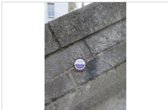
Repère normalisé de l'inondation du 17 novembre 1974