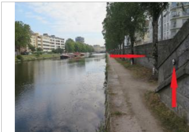
Quai de la Prévalaye escalier face à la rue des Trente