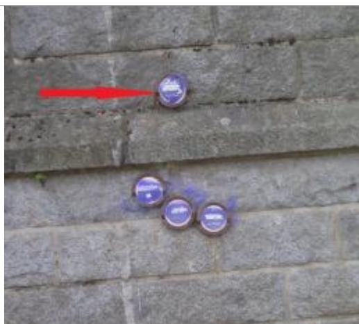
Repère normalisé de l'inondation du 26 octobre 1966

Altitude calculée de l'eau (en m) : 25.1 m