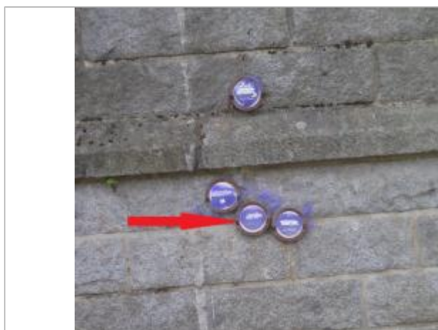
Repère normalisé de l'inondation du 21 janvier 1995