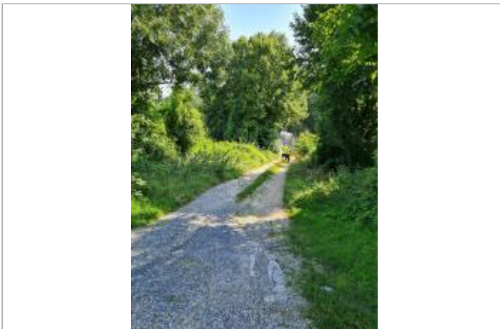
Sol sur chemin en terre, qui débouche sur la RD 1044, sur la rive gauche de l'Aisne après le pont (à 20 m)

GÉOLOCALISATION Coordonnées WGS84 : X: 3.90095470 / Y: 49.40062400 Coordonnées RGF93 (Lambert 93) X: 765414.6 / Y: 6922722.01 Coordonnées RGF93 (ETRS89) : X: 3.9009547 / Y: 49.400624 Code Hydro: H1--0200 Rive de référence: Gauche