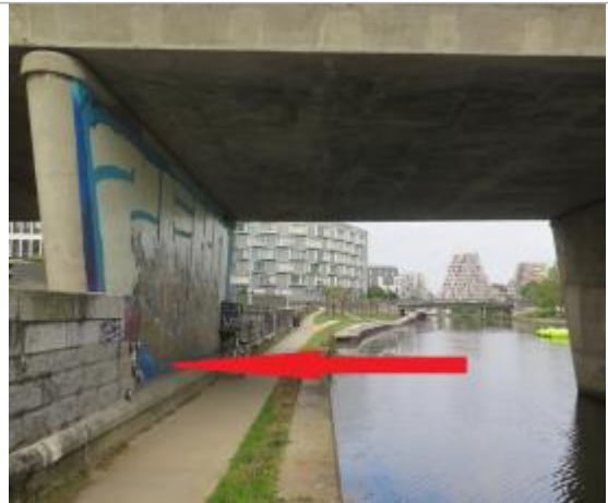
Muret de protection sous le pont Malakoff rive gauche