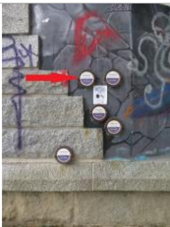
Repère normalisé de l'inondation du 26 octobre 1966