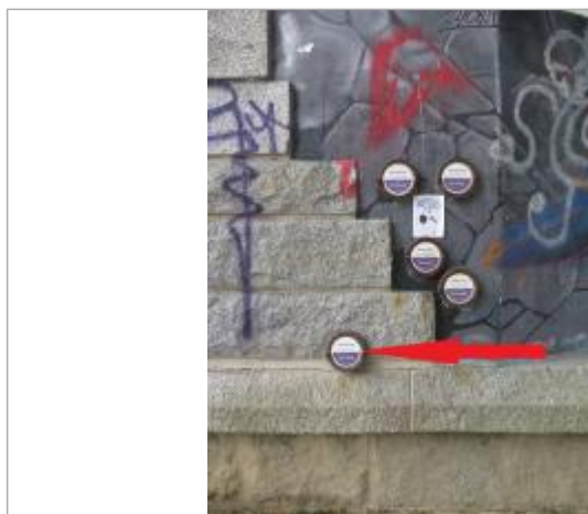
Repère normalisé de l'inondation du 21 février 1977