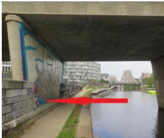
Muret de protection sous le pont Malakoff rive gauche