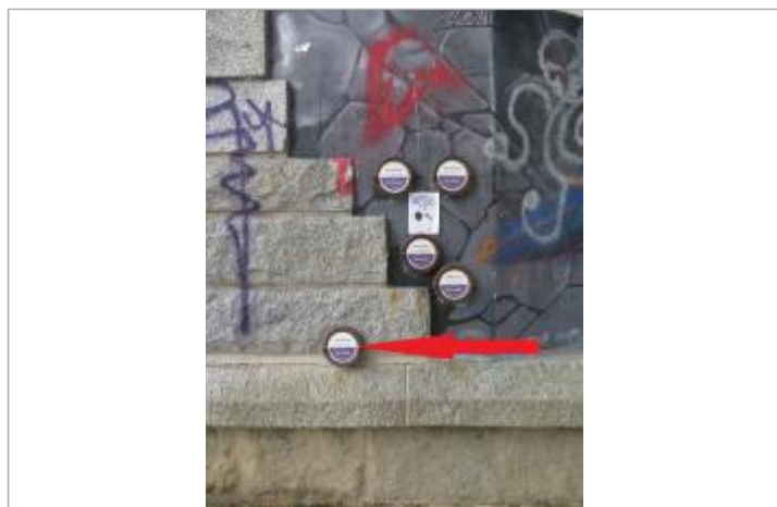
Repère normalisé de l'inondation du 21 février 1977