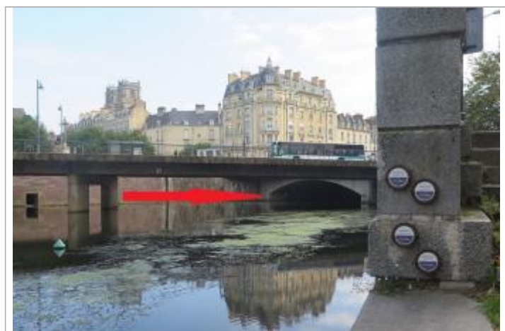
Repères de crues quai de la Prévalaye et pont de la Mission

Altitude calculée de l'eau (en m) : 25.14 m