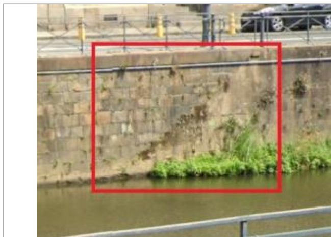
Escaliers disparus en face de l'ancienne école dentaire