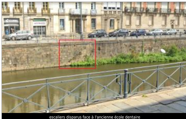
escaliers disparus face à l'ancienne école dentaire